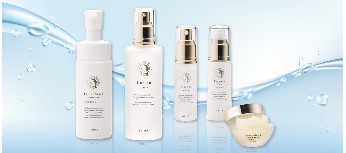
健やかな美肌のための基礎化粧品 うるおいシリーズ