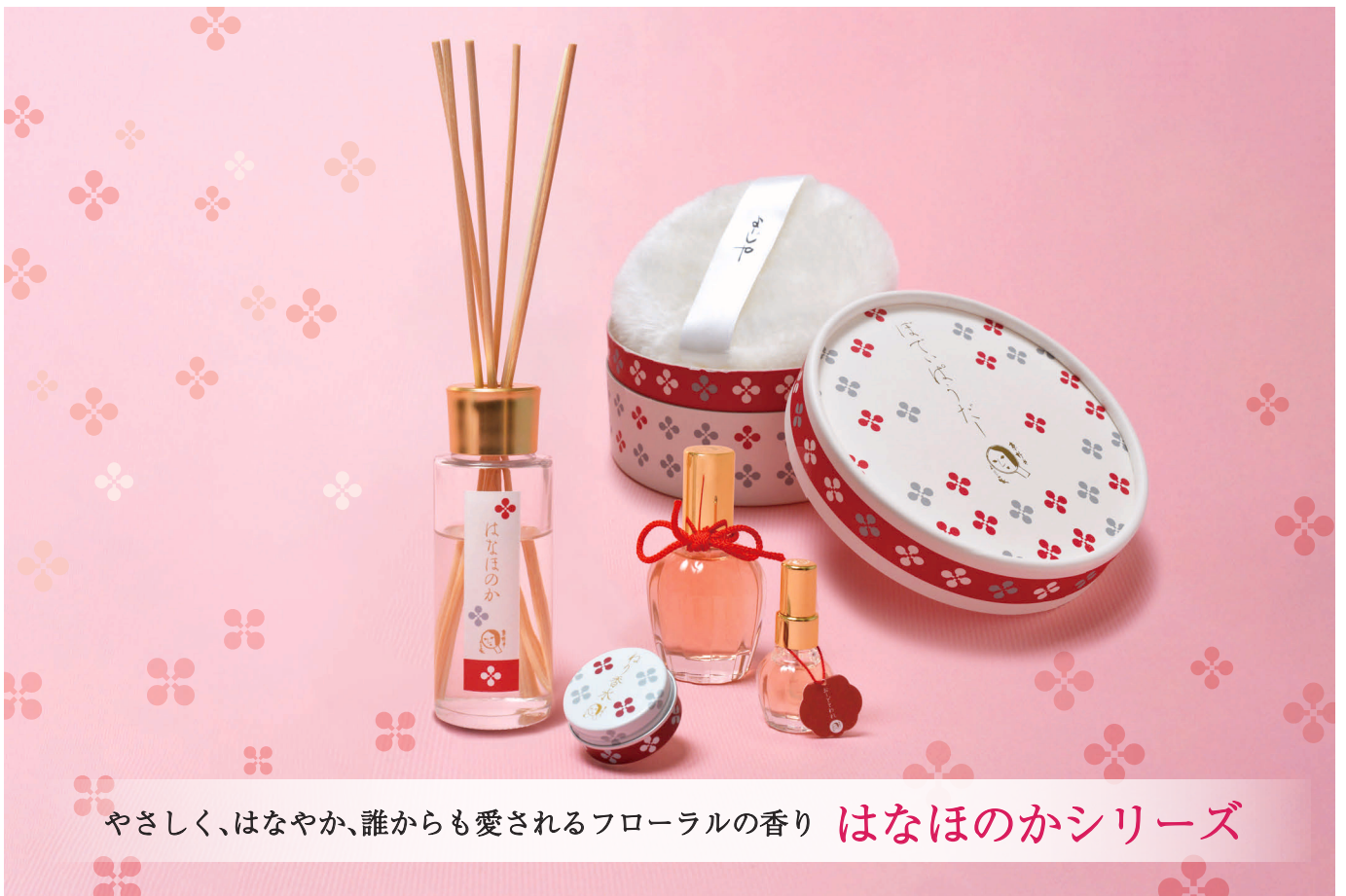
やさしく、はなやか、誰からも愛されるフローラルの香り はなほのかシリーズ