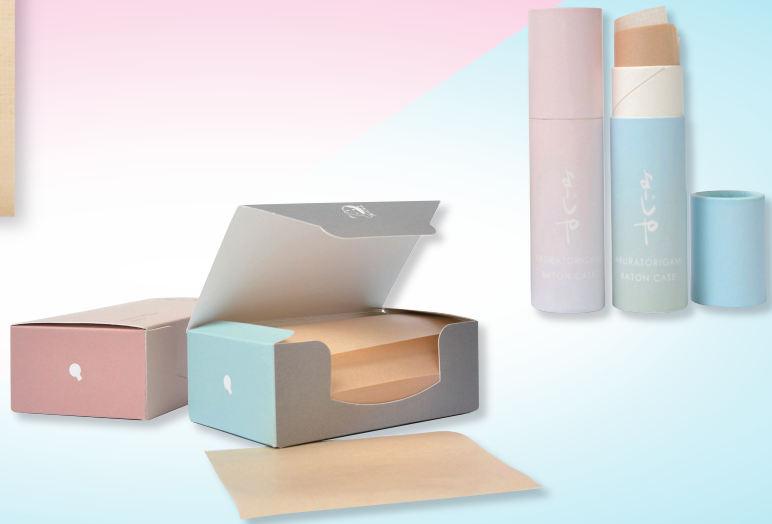
そっと1秒ふれるスキンケア あぶらとり紙