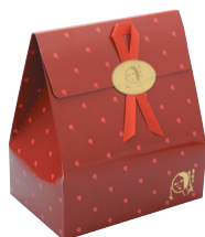
プチギフトパッケージ

商品番号 616-027 ¥125(税込) 縦11.0cm×横11.0cm×高さ3.3cm