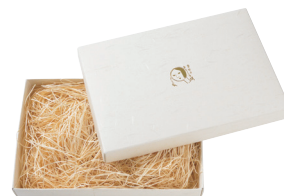
化粧箱 (ハンカチ用)

商品番号 616-023 ¥125(税込) 縦9.0cm×横13.6cm×高さ15.0cm