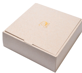
ギフトボックス 小

商品番号 616-029 ¥200(税込) 縦18.0cm×横18.0cm×高さ7.5cm