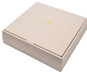
ギフトボックス 大

商品番号 616-029 ¥200(税込) 縦18.0cm×横18.0cm×高さ7.5cm