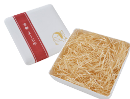
あぶらとり紙ギフト箱

商品番号 616-030 ¥220(税込) 縦21.5cm×横23.0cm×高さ7.5cm