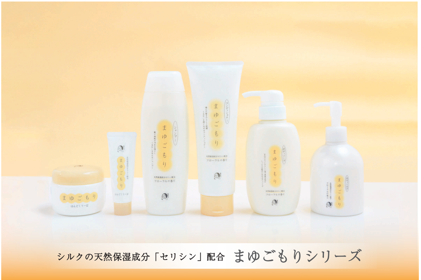
シルクの天然保湿成分「セリシン」配合 まゆごもりシリーズ